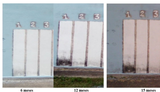
Figura 4. Resultados de la aplicación del recubrimiento con zeolita en pared de mampostería

Bellotti N., Bogdan S., Deyá C. & Amo B.d. 2011. Evaluación de la actividad antifúngica de una sal de amonio cuaternario para su aplicación en pinturas. 3er Congreso Iberoamericano y XI Jornada de Técnicas de Restauración y Conservación del Patrimonio. Tópico 3 No. 15:9.