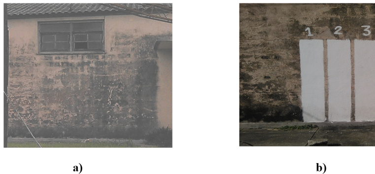
Figura 1. Imagen de las pruebas de uso con pintura modificada. a) Antes de pintar y b) después de aplicada la pintura.

Estos consistieron en inocular varios microorganismos en las respectivas muestras de pinturas y evaluar el crecimiento microbiano en el