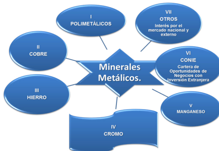
Figura 2. Agrupación de los minerales metálicos cubanos en subgrupos (I, II, III, IV, V, VI y VII)

de Au - Ag presentes allí, existen también depósitos de Cu - Zn con Au, Ag y a veces Ti, entre los cuales figuran Santa María, Charco Prieto y Las Margaritas, en la región de Sagua - Baracoa se localizan depósitos poco estudiados, de Cu - Ni y de Cu - Zn con Au (Elección, La Cruzada y otros). Existen depósitos de Cu - Mo porfíricos en la región central y en la provincia de Camagüey, se destaca Arimao (Cienfuegos) que presenta zonas enriquecidas con Au al igual que Tres Casas I, Palo Seco y Guáimaro también en la provincia de Camagüey. En la Sierra Maestra también existen pequeñas ocurrencias de este tipo, como Buey Cabón, La Cuaba y Santa Rosa, que presentan un bajo grado de estudio. En la mayoría de las menas polimetálicas cubanas son aplicables los procesos de beneficio por flotación, en algunos casos se obtienen concentrados comerciales y en otros casos requieren el tratamiento metalúrgico posterior para su refinación con la posibilidad de obtener Pb, Cu, Zn, otros metales valiosos como Au, Ag, Co, Ga, Ge, Cd, Mo y cantidades considerables de ácido sulfúrico, como se aprecia en la tabla 2 en la que se resume la información sobre los yacimientos, tecnología empleada y resultados obtenidos del procesamiento.