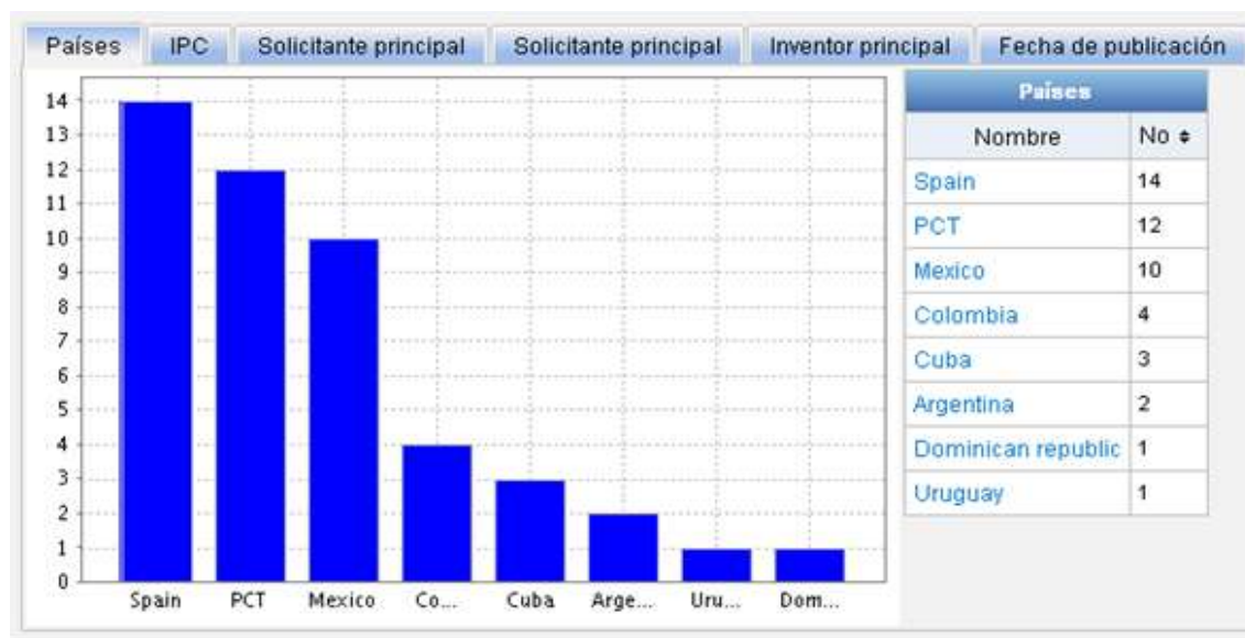
Figura 1. Comportamiento del registro solicitudes de patente por país PATENTSCOPE.

Para este pequeño estudio se realizó una búsqueda en la base de datos WIPO PATENTSCOPE el cual publica solicitudes y patentes nacionales e internacionales del PCT. Se reportó la siguiente información (47 patentes)